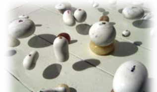
「INDY BINDI」 渡辺秀亮 大理石、ガラス、ビンディ